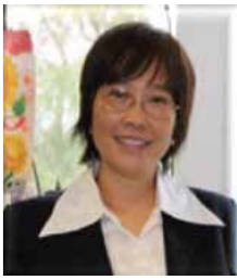
馬麗莊教授 香港中文大學 社會工作學系

馬教授的研究專長及領域包括家庭治療及精神健康，近年主要集中於研究進食失調症及專注力失調及過度活躍症患者的治療。馬教授從 1988 年起一直在中文大學執教，亦是美國婚姻與家庭治療協會的認可專業督導。她在深圳南山醫院開辦了深港家庭治療中心，為內地的有需要人士提供家庭治療，推動社會工作在內地的發展。馬教授亦是社工系家庭及小組實務研究中心的董事，至今一直為本港的家庭治療及小組工作奠定了理論及實務基礎。於 2013 年 1 月，馬教授被香港家庭治療學院委任為臨床副主任。於 2014 年 3 月，馬教授亦被國際家庭治療協會委任為任命及認證委員會之其中一員。